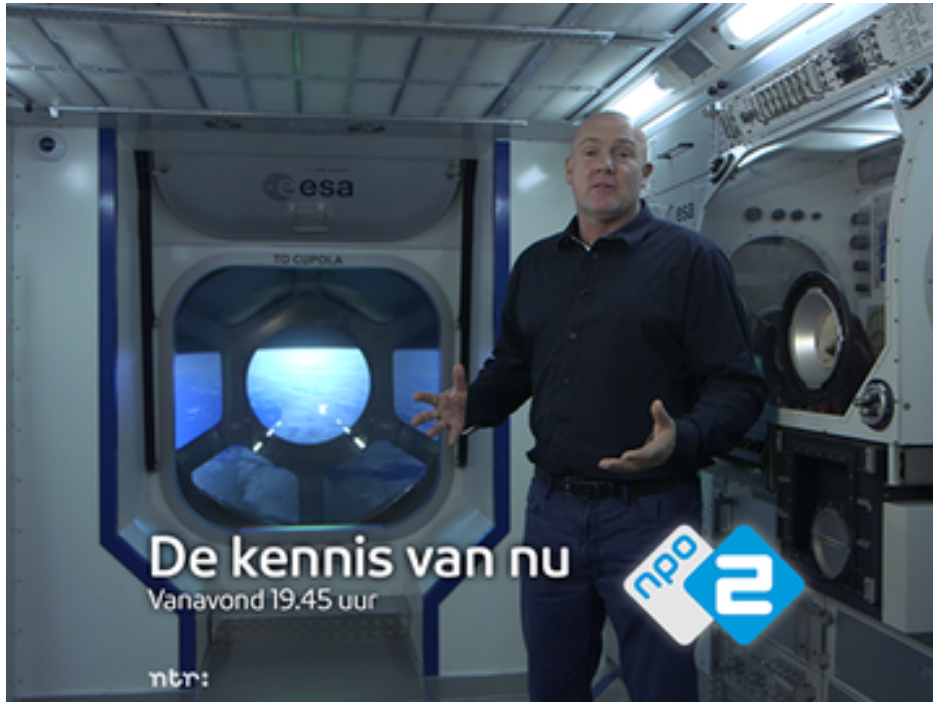
📷 De Kennis van Nu

Op 7 december 2014 gaat het TV-programma De Kennis van Nu ( http://www.npowetenschap.nl/programmas/dekennisvanu.html ) over de 'ondertitelbril': 19.45 op NPO2. André Kuipers test of je er iets aan hebt als dove.